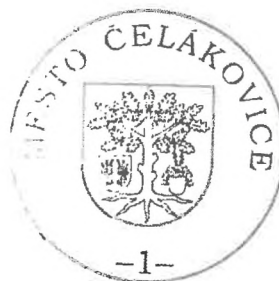
Ing. Josef Pátek starosta města Čelákovice

Za správnost výpisu: Čelákovice 7. 9. 2022